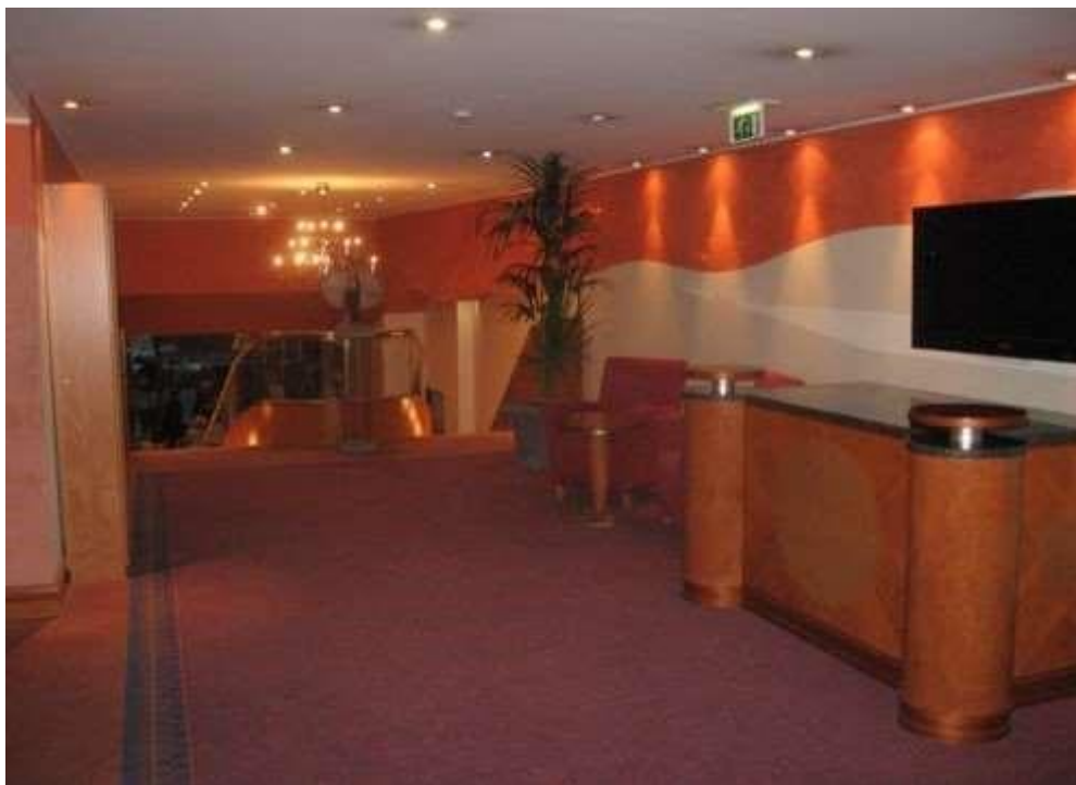
Kuva 1. Metropol-hotellin aula (Kivi 2015)

Taulukon, kuvion ja kuvan ylä- ja alapuolelle jätetään yhden rivin verran tyhjää tilaa. Taulukon, kuvion ja kuvan koko sisältöä ei selosteta uudelleen tekstissä, vaan tietoja arvioidaan ja niistä tehdään johtopäätöksiä. Kuvioissa ja taulukoissa ei tarvitse noudattaa opinnäytteen ulkoasuohjetta; esimerkiksi kirjasinlaji ja riviväli voivat olla erilaiset.